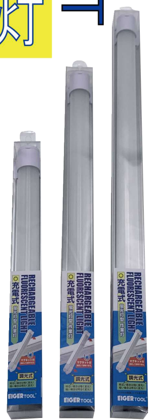
EKM7658 EKM7659 EKM7660