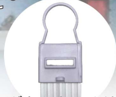
マグネットとフック付き