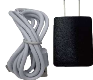
USBコンセントとコード付き